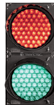
Semáforo con lámparas de 20 cm diámetro