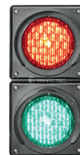
Semáforo con lámparas de 10 cm diámetro