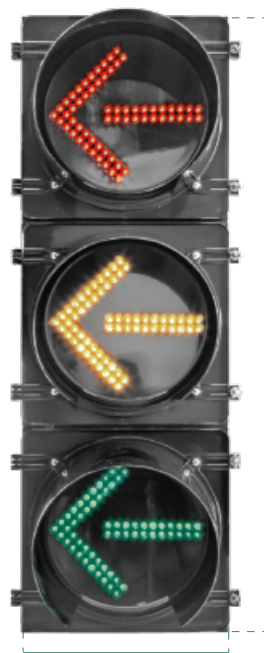
35 cm VISTA FRENTE