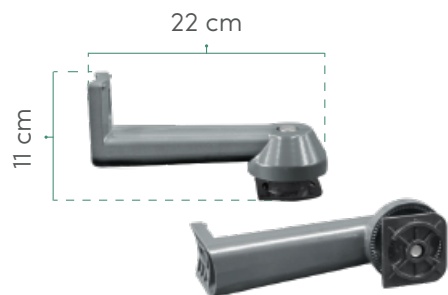
2 BRAZOS DE MONTAJE DE ALUMINIO Se cotizan por separado.