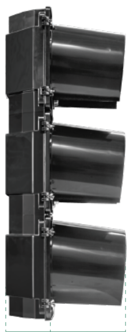
18 cm 26 cm LATERAL DERECHO