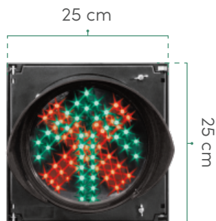
VISTA FRENTE Lámparas encendidas.