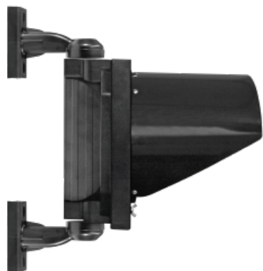
LATERAL DERECHO Con brazos de montaje.