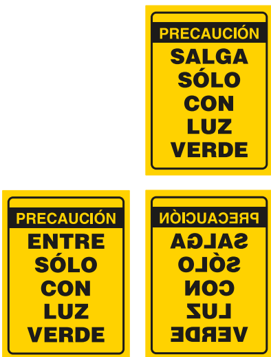
3 letreros de seguridad, color amarillo, 30 cm x 40 cm.