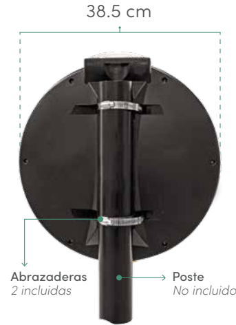
VISTA TRASERA Montado en poste / soporte