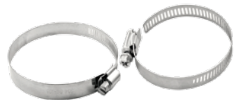
2 ABRAZADERAS DE ACERO INOXIDABLE INCLUIDAS