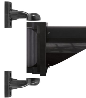
VISTA IZQUIERDA Con brazos de montaje