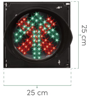
VISTA FRENTE Con lámparas encendidas