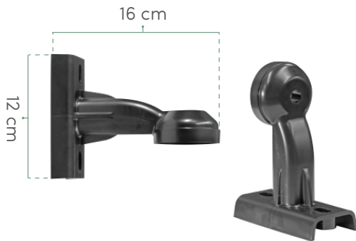
2 BRAZOS DE MONTAJE DE POLICARBONATO