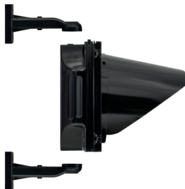
VISTA IZQUIERDA Con brazos de montaje