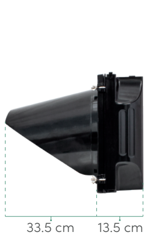
VISTA DERECHA Sin brazos de montaje