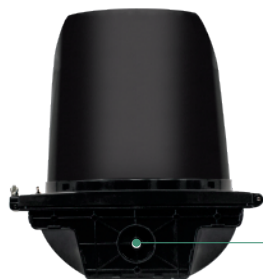
VISTA SUPERIOR MÓDULO CARCASA