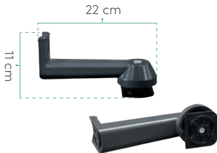
2 BRAZOS DE MONTAJE DE ALUMINIO Se cotiza por separado