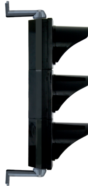
VISTA IZQUIERDA Con brazos de montaje