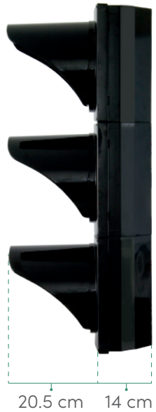
VISTA DERECHA Sin brazos de montaje