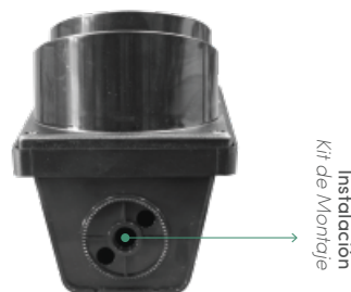
VISTA SUPERIOR MÓDULO CARCASA