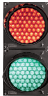
SEMÁFORO INDUSTRIAL Rojo-Verde, Lámparas 20 cm (8").