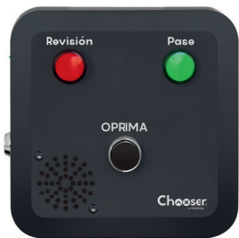
CHOOSER Controlador para Selección Aleatoria.

*EQUIPOS TRAFICTEC COMPATIBLES CON ESTE ACCESORIO: