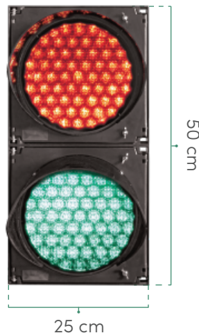
VISTA FRENTE Lámparas encendidas.