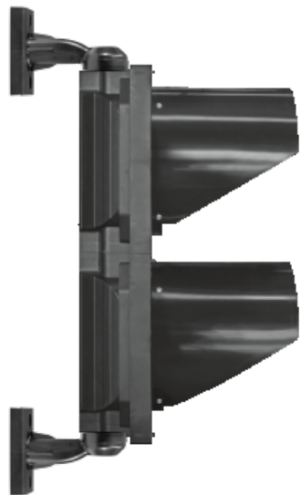
LATERAL DERECHO Con brazos de montaje.