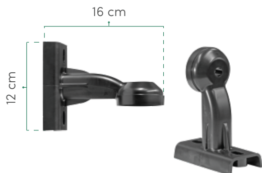
2 BRAZOS DE MONTAJE DE POLICARBONATO