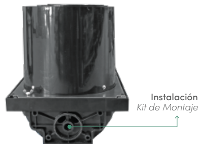
VISTA SUPERIOR SEMÁFORO INDUSTRIAL 20 CM