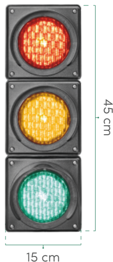
VISTA FRENTE Lámparas encendidas.