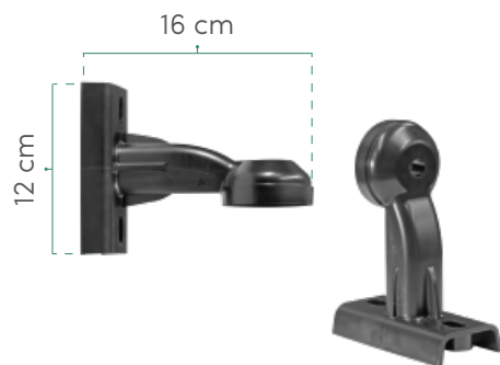
2 BRAZOS DE MONTAJE DE POLICARBONATO