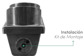
VISTA SUPERIOR SEMÁFORO INDUSTRIAL 10 CM