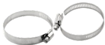
2 ABRAZADERAS DE ACERO INOXIDABLE